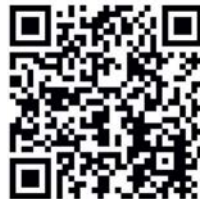
Abb. 8 Mundpflege 3D

Ebenfalls sollen hier ab dem kommenden Jahr nach und nach Mundhygiene-Maßnahmen wie die Pflege der Zähne, der Zahnzwischenräume, der Zunge sowie der Schleimhäute, der Einsatz spezieller Pflege- und Hilfsmittel sowie der sichere Umgang mit technisch aufwendigen Zahn-ersatz-Versorgungen gezeigt werden.