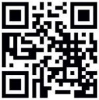
Abb.2 Infos zum Experten- standard Mund- gesundheit

Erst nach dieser Phase wird der Expertenstandard finalisiert und im Rahmen eines Workshops – voraussichtlich im September 2022 – abschließend veröffentlicht. Weitere und aktuelle Infos rund um den Expertenstandard zur Förderung der Mundgesundheit können auf der Homepage des Deutschen Netzwerks zur Qualitätsentwicklung in der Pflege nachgelesen werden.