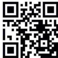
Abb. 9 Die Supernurse-Quiz-App