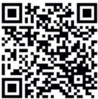
Abb. 7 Schulungsmittel der Deutschen Gesellschaft für AlterszahnMedizin